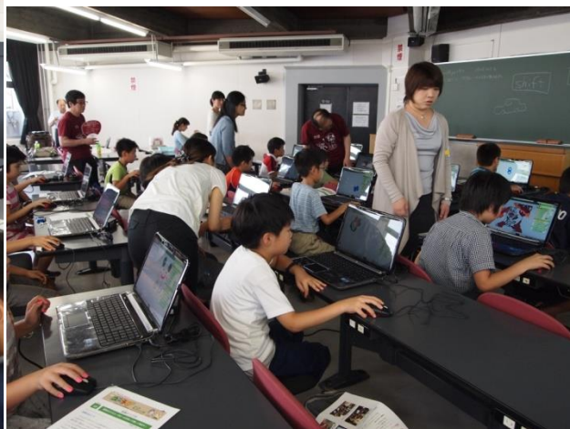
サポーターも大活躍